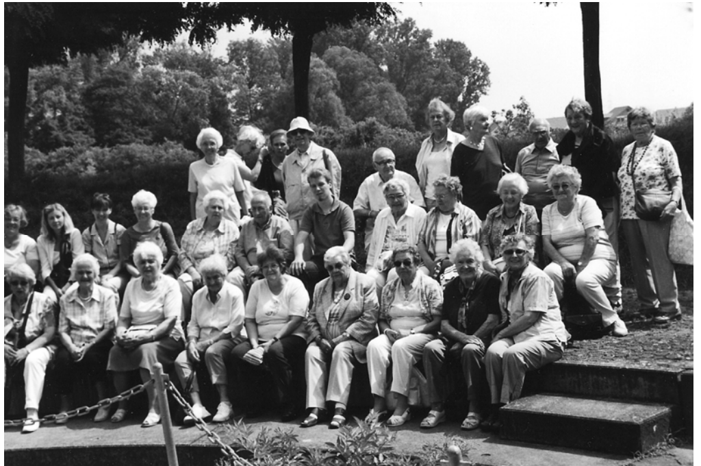
Die unternehmungslustigen Markus-Senioren und -Seniorinnen bei einer Rast im Straußenpark Mhou in Rülzheim

Aber es gab noch eine Besonderheit: Vor vier Tagen waren Kücken ausgeschlüpft. Vorsichtig näherte sich die Besucherschar den kleinen neuen Lebewesen, die noch sehr schreckhaft sind, wie man ihnen gesagt hatte. Und dann Erstaunen, sie sahen aus wie Igel, wenn die Köpfchen gerade